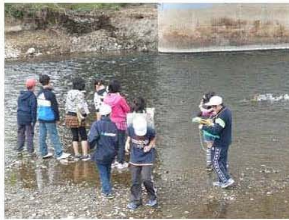
河原で川の様子や蛙の遡上等を観察している生徒たち