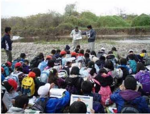
名取川について説明を受ける生徒達

しらかし台小学校5年生の計51名は、名取川流域において「川の大切さ」や「川の自然環境と水利用」・「川の中流・下流の様子の変化」について学習しました。