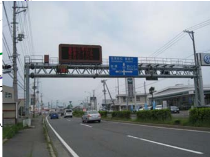
道路情報板イメージ