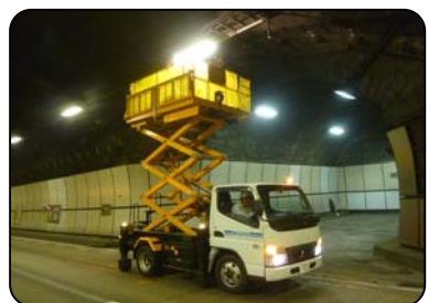
写真3 トンネル照明設備の点検