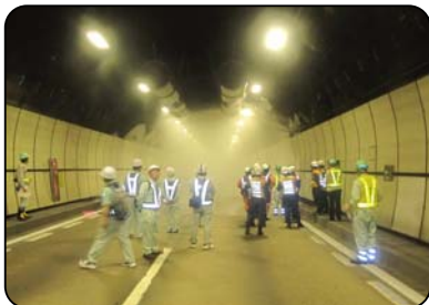
写真1 スプリンクラー動作確認