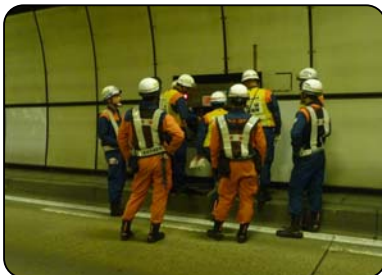
写真2 消防隊員による消防設備点検