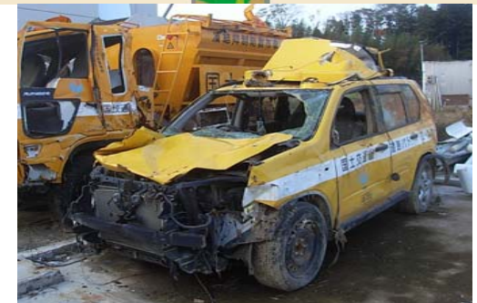
東日本大震災で被災したパトロールカー