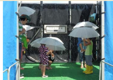
最大200mm/hの雨量が体験できる降雨体験機