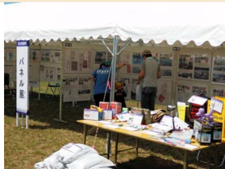
震災や今年7月の大雨及び長井ダムに関するパネル展