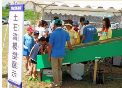
土石流の仕組みを体験できる土石流体験模型