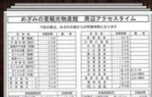
周辺アクセスタイム