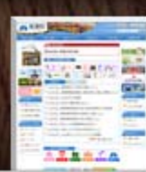
飯豊町ホームページ