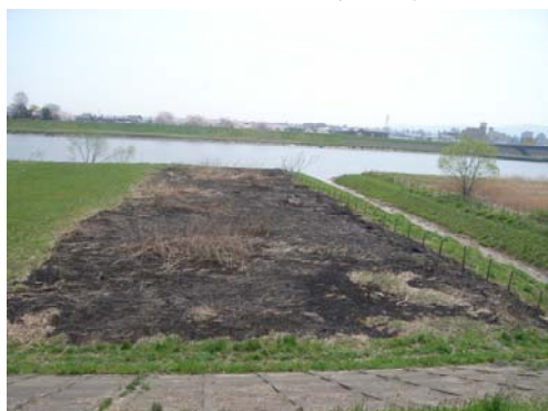
河川敷の火災による焼失状況写真

[集合場所] 馬淵川河口部右岸河川敷（八太郎大橋上流部） 青森県八戸市河原木字海岸（別添図参照） 13時20分