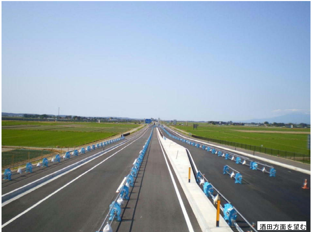
鶴岡北改良の4車線化工事の状況(H24.6.27供用予定)