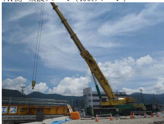
A1側 架設クレーン(400tクレーン)