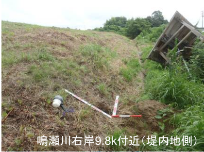
鳴瀬川右岸9.8k付近(堤内地側)