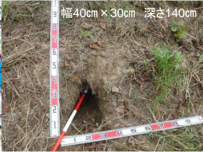
幅40cm × 30cm 深さ140cm