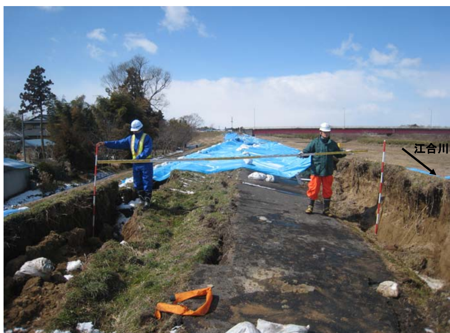
3月19日 9時 緊急復旧工事に着手