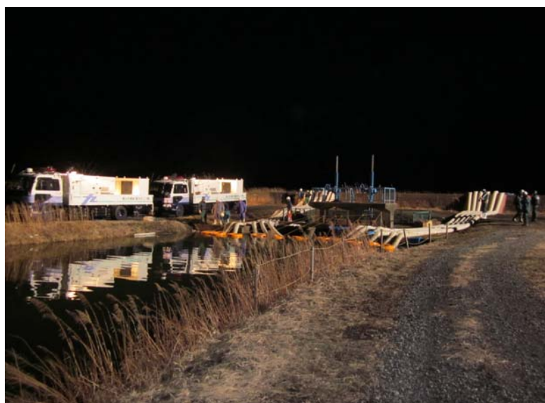
石巻市井内の浸水解消のための排水状況 (井内排水機場が稼働できないため) 18日23時30分撮影