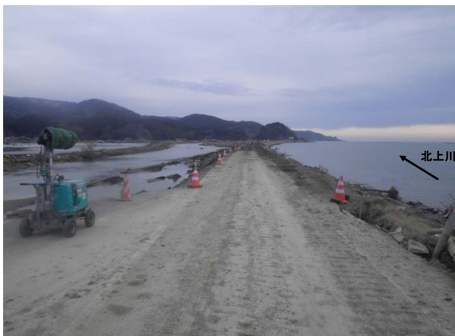
堤防決壊箇所が3月18日6時通行可能となる