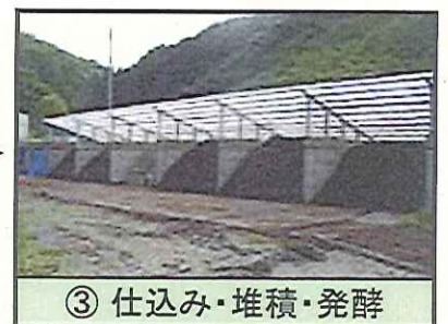
③ 仕込み・堆積・発酵