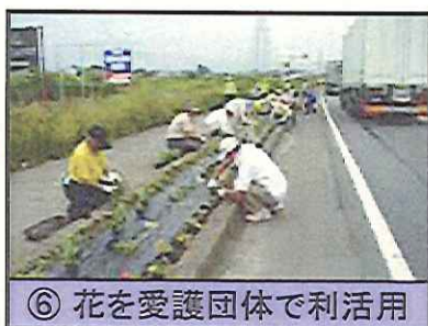
⑥ 花を愛護団体で利活用