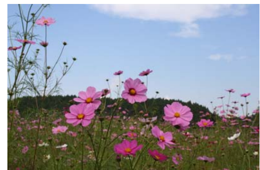
写真はすべて10月17日撮影