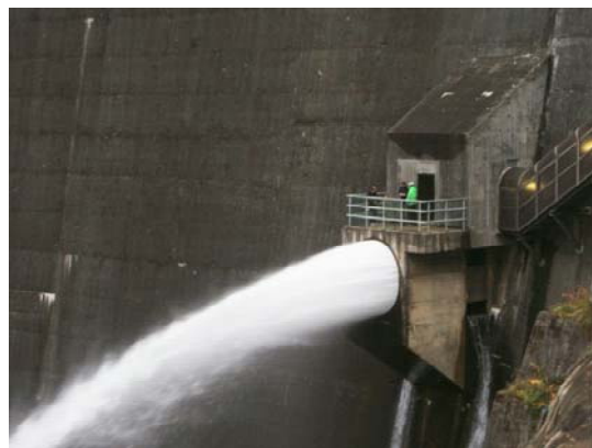
【ダム放流の様子（昨年）】

鳴子ダムホームページ http://www.thr.mlit.go.jp/naruko/ ※発表記者會 古川記者クラブ