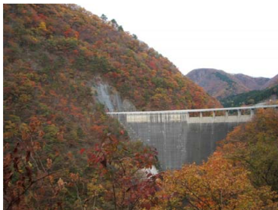
【鳴子ダム周辺の紅葉（昨年）】

※気象状況により、ダム放流及びダム見学会を中止させていただく場合がありますので、ご了承ください。