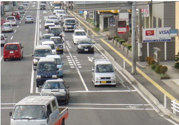
(国道4号の仙台方面から東京方面を望む)