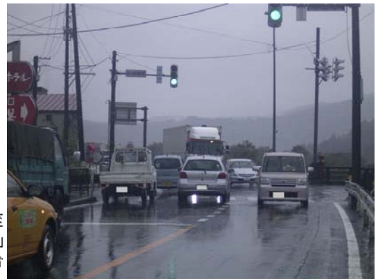
[右折車を回避した通行が可能に。]

<発表記者会：宮城県政記者会・東北電力記者クラブ・東北専門記者会・大崎記者クラブ>