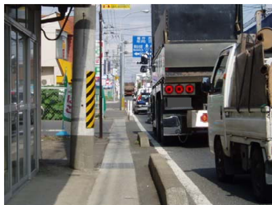
中田五丁目地内（名取方向から仙台方向を望む）