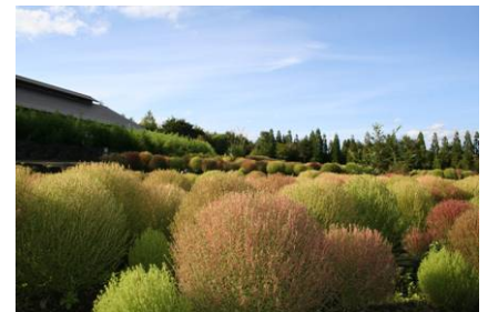
紅葉はじめのコキア(9/26撮影)