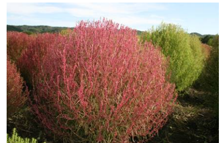
紅葉はじめのコキア(9/29撮影)