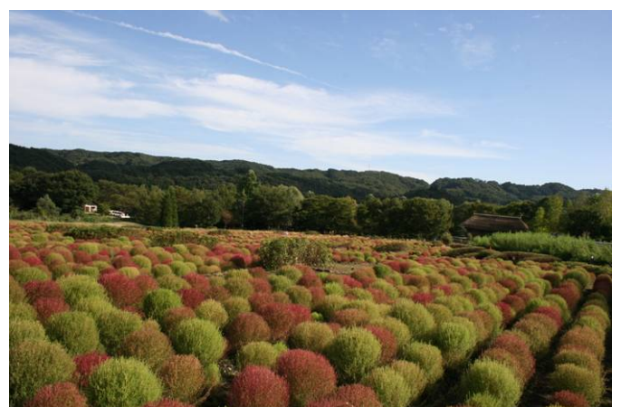
紅葉はじめのコキア(9/29撮影)