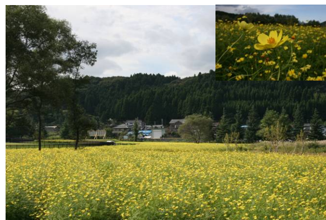
レモンブライト 見頃(9/29撮影)