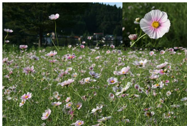
品種コレクション 日の丸 見頃(9/29撮影)