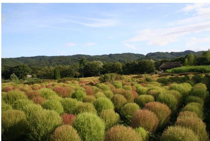
紅葉はじめのコキア(9/26撮影)