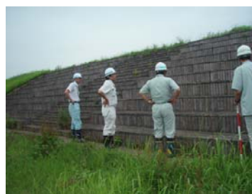
関係自治体と合同点検 (鳴瀬川：鳴瀬大橋上流階段護岸)