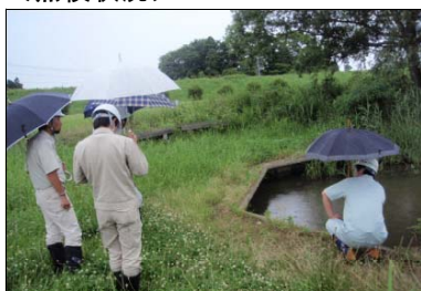
公園管理者・利用者と合同点検 (江合川：江合川河川公園)