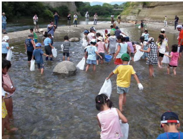
昨年の模様（イワナのつかみどり）

応募チラシの配布先は、江合川流域の大崎市・美里町・涌谷町の全小学校、実行委員会の各機関、鳴子温泉郷観光協会、あ・ら・伊達な道の駅等でも配布しております。今年も皆さんのご参加をお待ちしています！