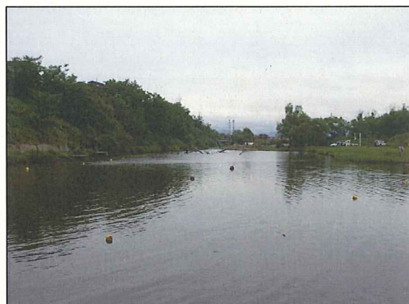
▲現在の三角沼(旧雄物川ワンド)