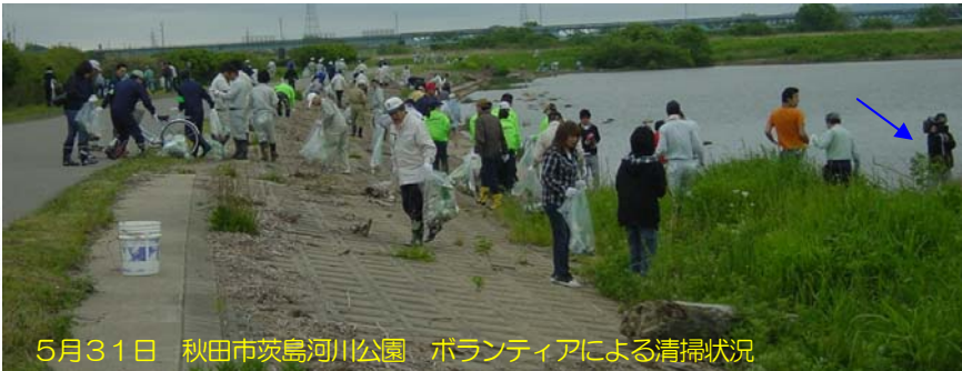
5月31日 秋田市茨島河川公園 ボランティアによる清掃状況