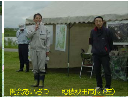
開会あいさつ 穂積秋田市長(左)