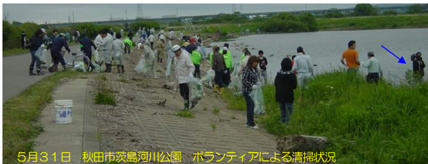
5月31日 秋田市茨島河川公園 ボランティアによる清掃状況