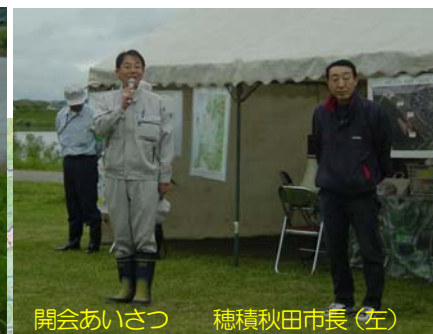
開会あいさつ 穂積秋田市長(左)