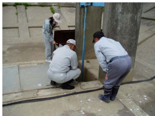
昨年度の点検状況（H20.6.16ニッ井出張所管内）

点検の結果、異常箇所が確認された場合には、その是正についての指導、助言を施設管理者に行い、改善を進めます。