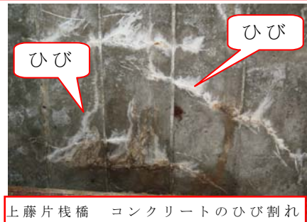
上藤片棧橋 コンクリートのひび割れ

長年、車や人の重さを支えてきた橋の舗装下のコンクリート面に、ひび割れができています。 このまま放置しておくともコンクリートに穴が空くなど損傷が広がり事故につながる恐れがあります。 損傷が大きくなる前に、傷んだコンクリートを新しいコンクリートに取り替えます。