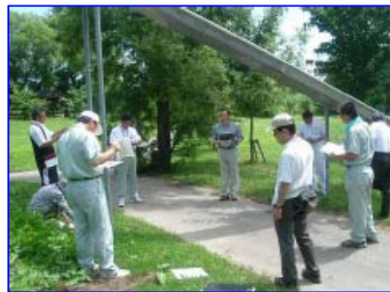
遊具の状況を点検しているところ （みずべのわんぱく広場）