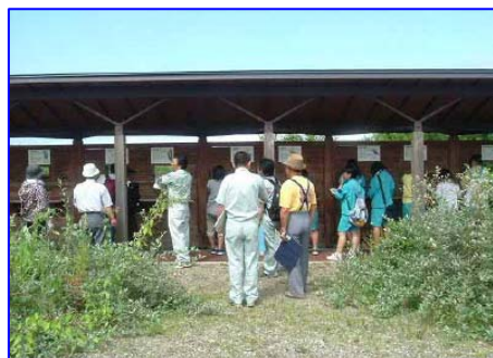
野鳥観察施設を点検しているところ （みずべの学習ひろば）