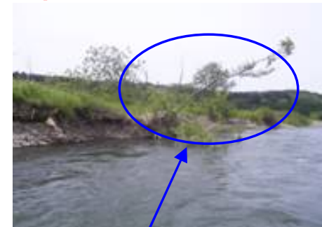
昨年の船上点検により発見された川側への倒木

翔鷹大橋～阿仁川合流点までは、本来、鷹巣出張所の管理区間ですが、船着き場の都合により、19日ニツ井出張所管内として点検します