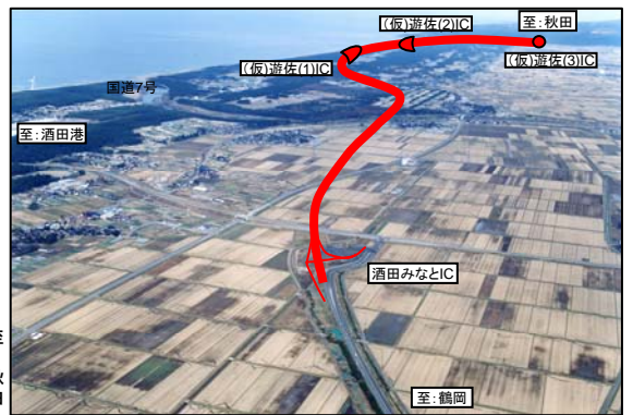
酒田みなとICから秋田方面を望む