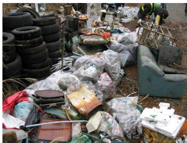
( 昨年 の 不法 投 棄 物 収 集 の 状 況 )