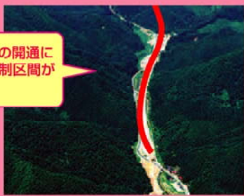
主寝坂道路付近の通行止め実績