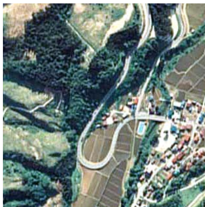
▲現道のヘアピンカーブ(金山町飛ノ森付近)