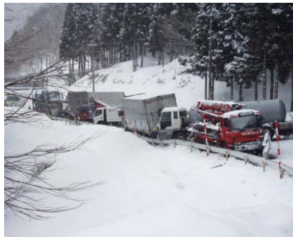
▲線形不良箇所での冬期多重事故