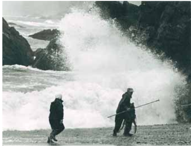
「荒れる海(A)」 (陸中海岸国立公園 大沢海岸 1968年)

2007.3月12日(月)～4月13日(金)まで 国道45号宮古商業高校前地下道「市民ギャラリー」