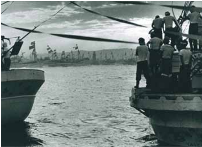
「サンマ漁解禁 出港」 (宮古市鯨ヶ崎 市場前 1955年)