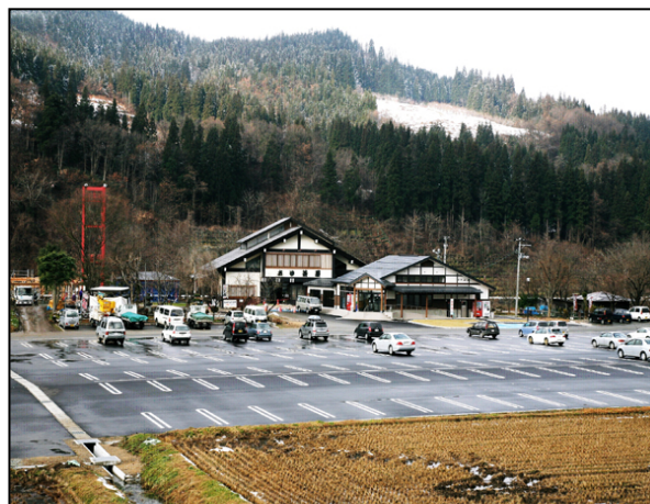
「道の駅」白鷹ヤナ公園