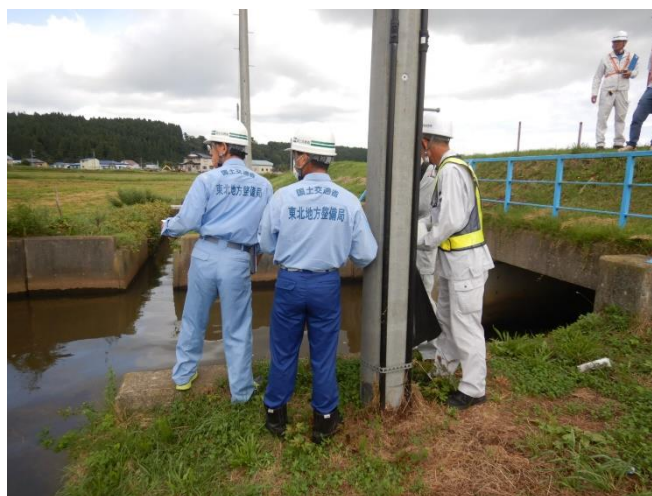
排水樋門の点検状況