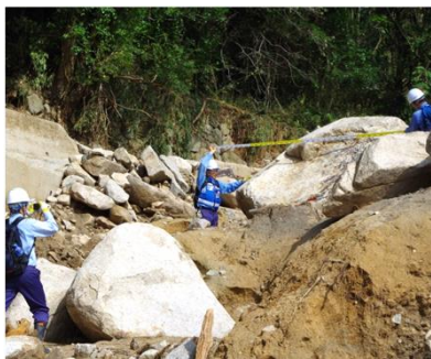
土砂災害被害状況の調査