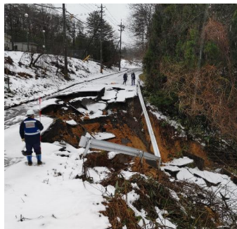
道路被害状況の調査