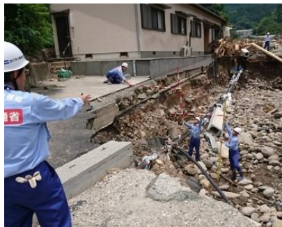
河川被害状況の調査