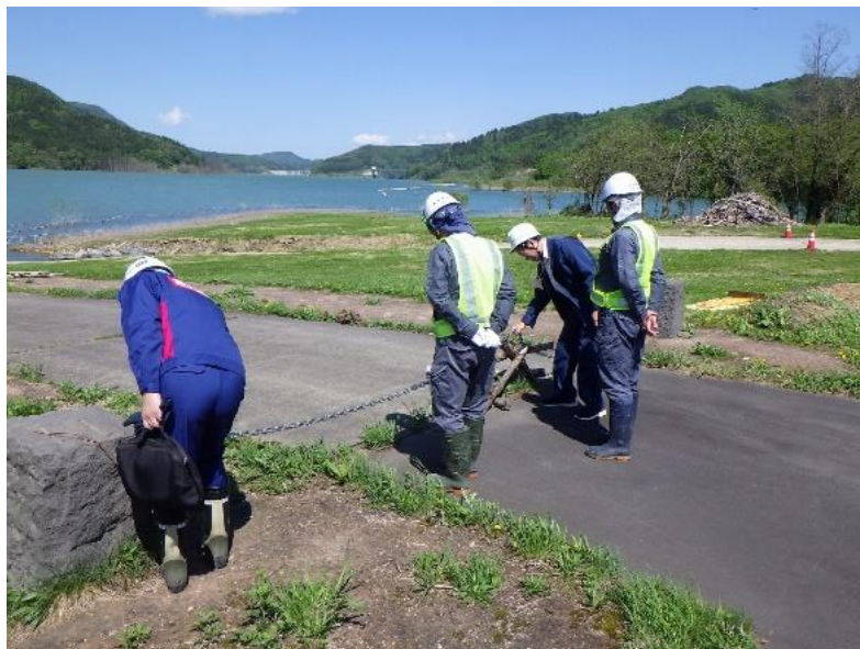
点検状況(津軽白神湖パーク)