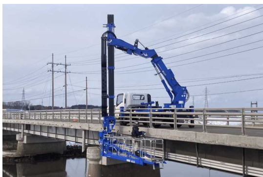
◀ 橋梁点検イメージ