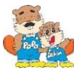
浅瀬石川ダムイメージ キャラクター パパとアッチャン