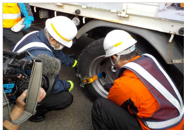
チェーン装着訓練