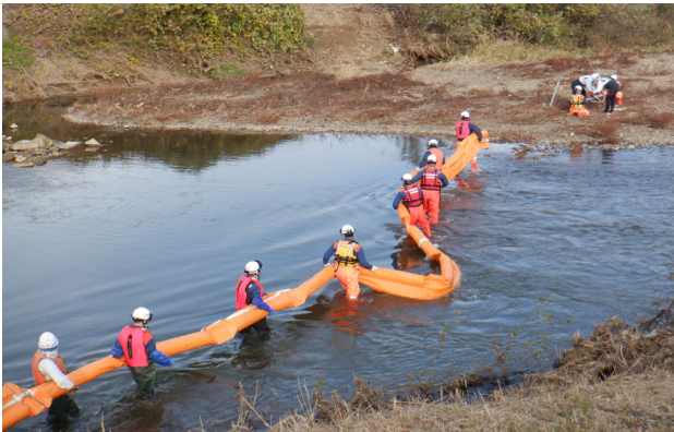
オイルフェンス設置訓練(1)