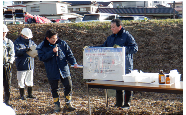
水質異常時の現地での初期対応訓練