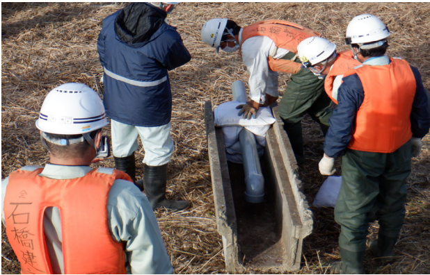
側溝での油流出防止訓練