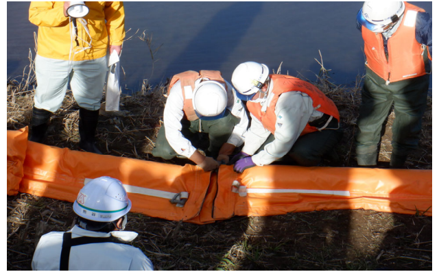
オイルフェンス接続訓練