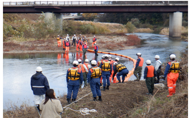
オイルフェンス設置訓練(2)