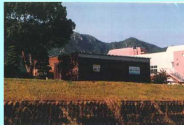
市民団体による活動拠点の整備事例（佐波川）