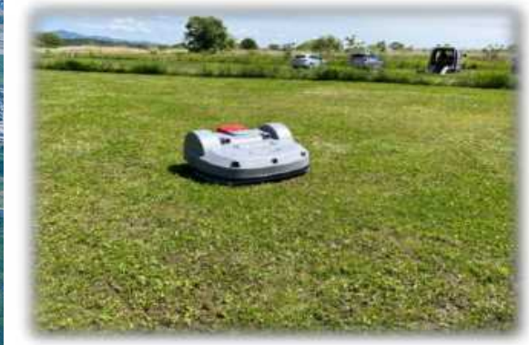
③ ロボモア (無人式)