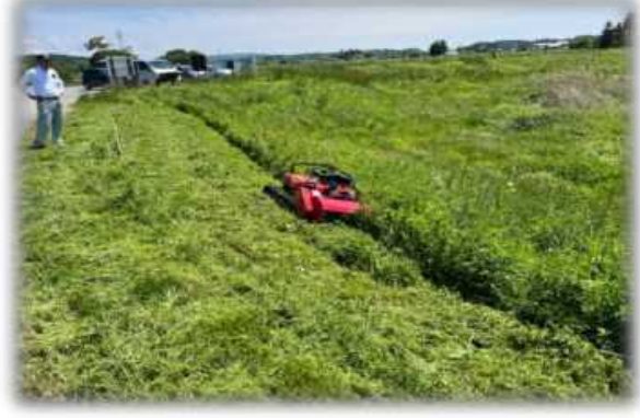
① リモコン小型ハンマーナイフ (ラジコン式)