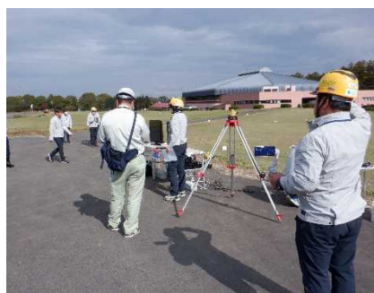
【岩手県会場 現地実習】 UAV レーザ測量