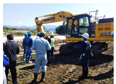
【山形県会場 現地実習】 ICT 建機操作実習