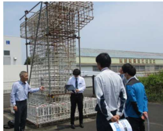
鉄筋検査システム体験