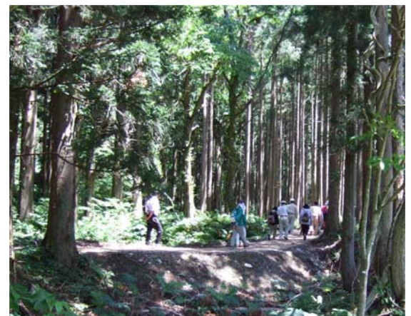
ウッドチップで歩きやすい杉並木の散策路