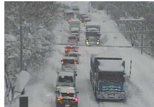
【写①】R3.12.27 国道4号の交通混雑状況