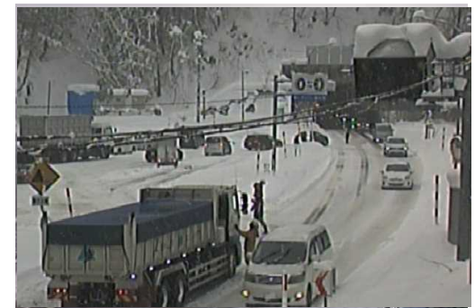
【写④】R3.12.28 国道13号の交通混雑状況