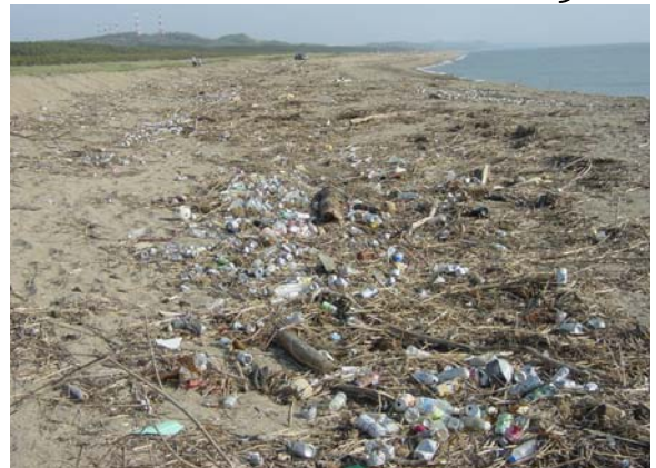
写真 雄物川河口に隣接する海岸の一般ゴミ