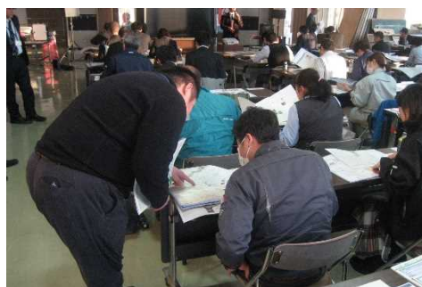
▲参加者からは積極的な質疑応答

マイタイムラインは、いざという時に慌てずに行動するために災害が起きると予測される時刻に向けて、いつ、誰が、何をやるのかあらかじめ決めておく防災のスケジュール表。今回は、住民普及に向けて主に雄物川流域市町村等の防災担当者を対象に講習会を開催。