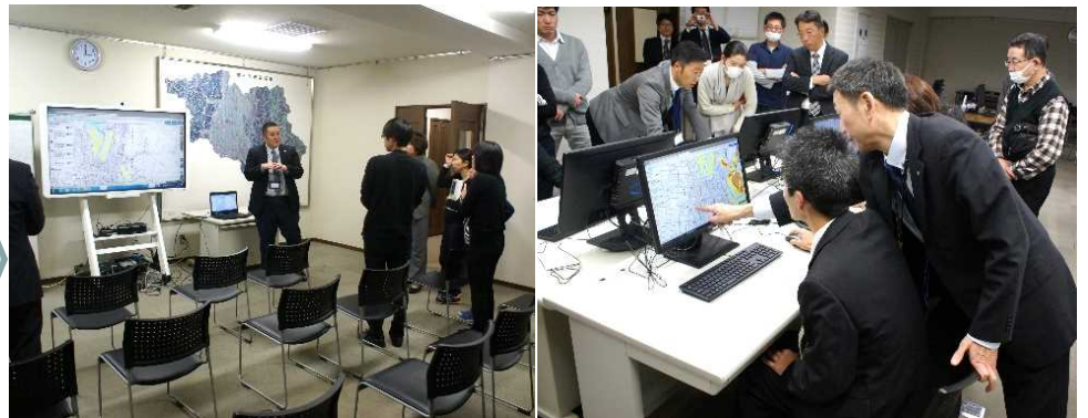
▲ハザードマップポータルサイトの体験コーナー

平成29年6月の改正水防法の施行に伴い、洪水浸水想定区域内に所在する要配慮者利用施設の管理者等は「避難確保計画の作成」及び「訓練の実施」が義務化