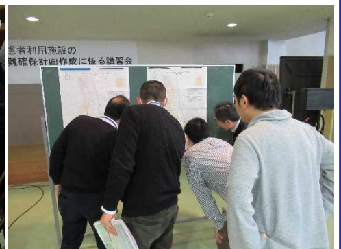
▲横手川浸水想定区域図を確認する参加者