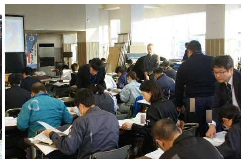
▲真剣に取り組む参加者の方々