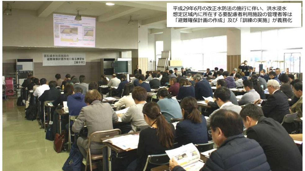
▲講習会の開催状況

参加者は、所属施設の位置や洪水時の想定浸水深などを確認し、避難場所や避難経路を検討する際の参考としていました。