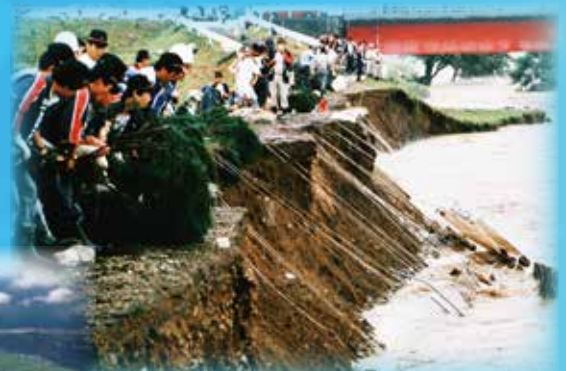
1987年(昭和62年) 河岸崩壊を抑える水防活動 (写真は横手市増田 成瀬川)