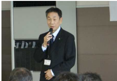
かまた ひろゆき ▲鎌田広行危機管理監挨拶

洪水からの「逃げ遅れゼロ」を目指し、横手市主催の下、国土交通省などの防災関係機関も協力し 要配慮者利用施設の管理者等を対象として避難確保計画作成講習会(前期)を開催