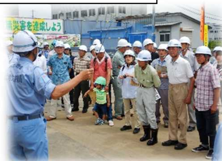
現地見学会(雄物川:国交省)

【目的】国交省が実施する雄物川河川激甚災害特別緊急事業及び秋田県が実施する土買川災害関連事業について、今しか見ることが出来ない最盛期の工事現場やICT活用工事などを地域住民の方にご覧頂き河川整備の必要性について理解を深めて頂くと共に、地域の小学生を対象として、気象・防災に関する知識を深め河川防災への意識啓発やいざという時の備えに役立てて頂くもの