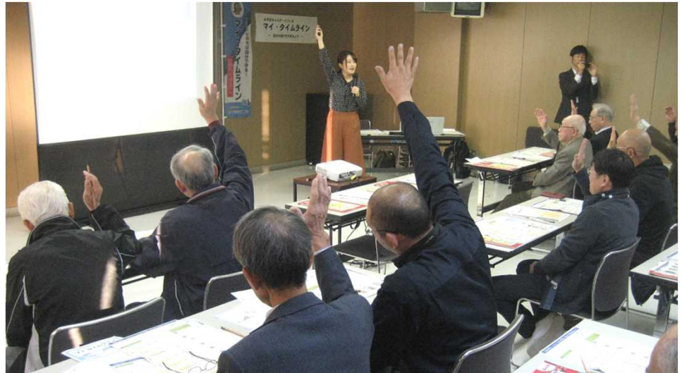
▲講習会の開催状況

マイタイムラインは、いざという時に慌てずに行動するために災害が起きると予測される時刻に向けて、いつ、誰が、何をするのかあらかじめ決めておく防災のスケジュール表です。今回は、台風を例にマイタイムラインを作成してもらいました。