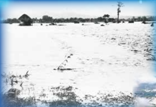
1947年(昭和22年) 雄物川の洪水氾濫 (写真は湯沢市山田 中川原橋付近)