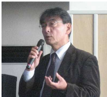
▲向井氏による講義の状況

秋田県横手市において「防災担当職員向けマイタイムライン作成講習会」を開催しました。