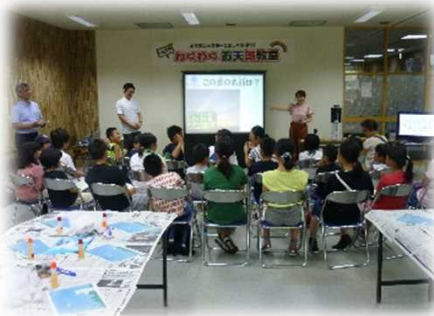
わくわくお天気教室