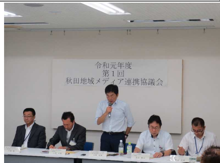
今野センター長 あいさつ