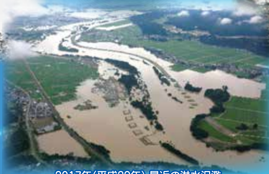
2017年(平成29年) 最近の洪水氾濫 (写真は大仙市寺館、協和峰吉川付近 雄物川)