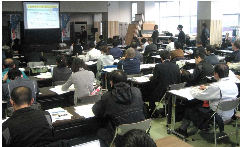
▲講習会の開催状況