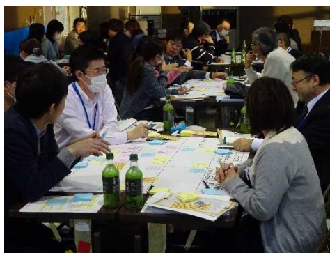
▲ワールドカフェ形式による活発な情報交換

「ワールドカフェ」とは？ 1つのテーブルに4~5人が 着席し、メンバーの組み合わ せを変えながら、本物のカフ ェのようにリラックスした雰 囲気の中で、テーマに集中し た対話を行う形式