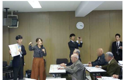
▲講師の説明に真剣に耳を傾ける参加者