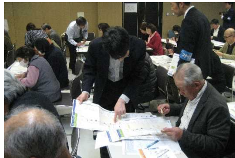
▲参加者からは積極的な質疑応答

マイタイムラインは、いざという時に慌てずに行動するために災害が起きると予測される時刻に向けて、いつ、誰が、何をするのかあらかじめ決めておく防災のスケジュール表です。今回は、台風を例にマイタイムラインを作成してもらいました。