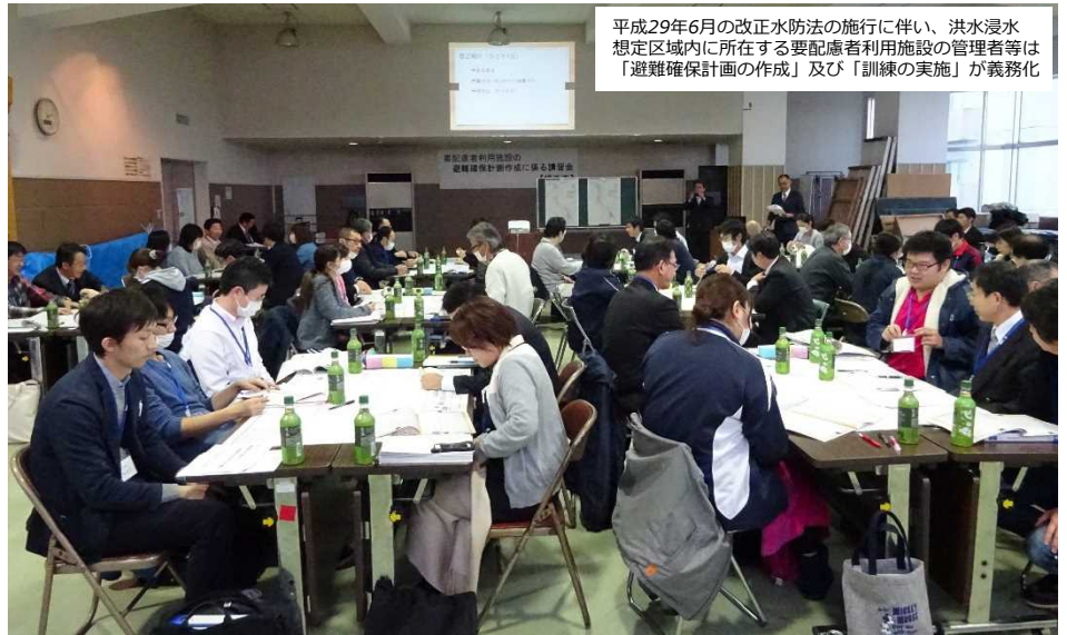
▲講習会の開催状況

平成29年6月の改正水防法の施行に伴い、洪水浸水 想定区域内に所在する要配慮者利用施設の管理者等は 「避難確保計画の作成」及び「訓練の実施」が義務化