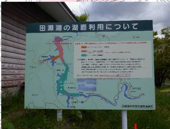
釣り公園看板(令和4年4月更新予定)