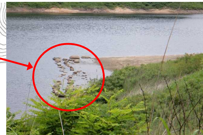
動力付きボート搬入箇所