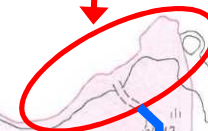
動力付きボート搬入箇所