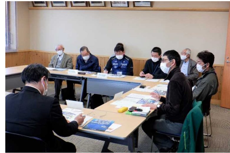
第1回懇談会の状況