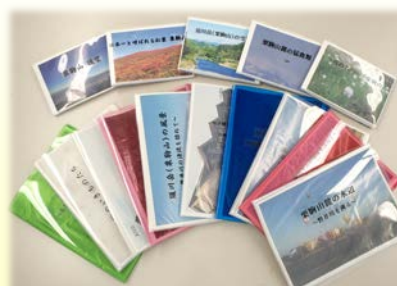
現在 15冊 提供して頂きました

北上川学習交流館「あいぼーと」には、一般市民の方からのご提供で、一関市の史跡、栗駒山や磐井川の絶景など、まだまだ知らない一関を発見できる写真がいっぱいあります。興味のある方は、ぜひ「あいぼーと」へご来館下さい。