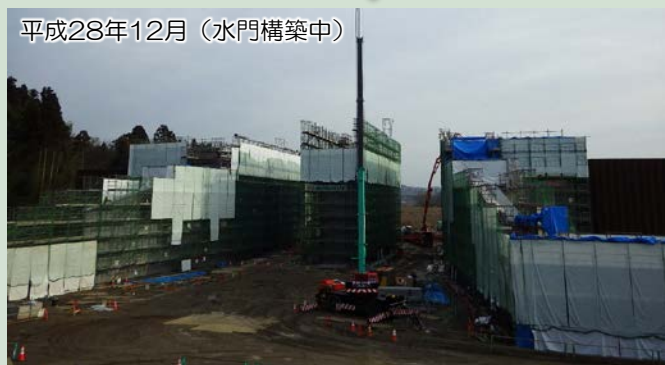
平成28年12月 (水門構築中)