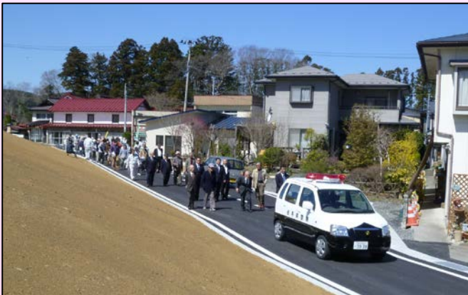
■付帯道路歩き始めの様子

諏訪前堤防については、堤防盛土は完了しましたが、堤防天端の舗装とのかげの種子吹付が残っていますので、引き続き皆様のご協力よろしくお願いします。