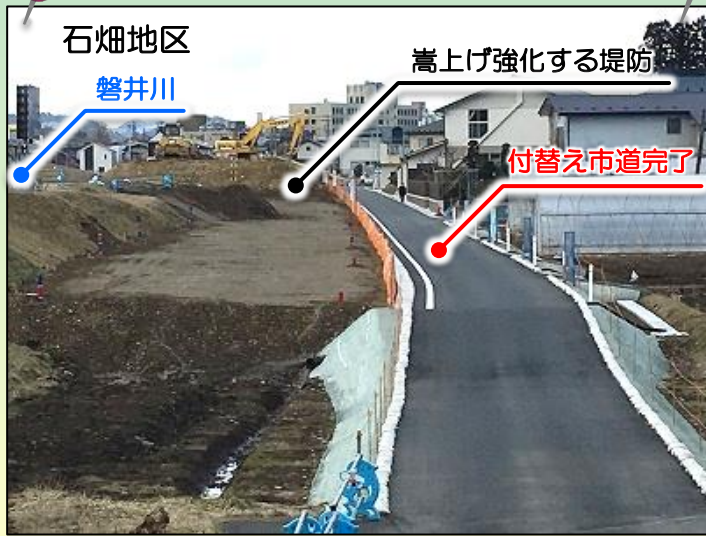
今後の施工 築堤盛土、法面張芝、歩道設置など