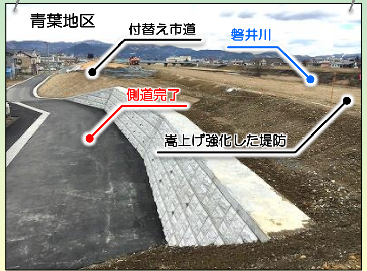
今後の施工 付替え市道、堤防天端の舗装、法面張芝など